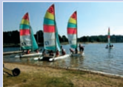
Centre Voile et Nature - Trémelin