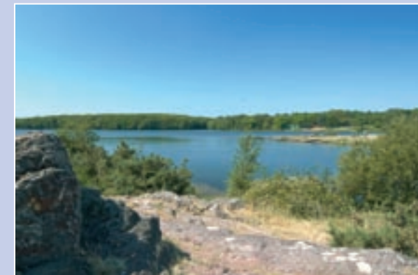
Domaine de Trémelin