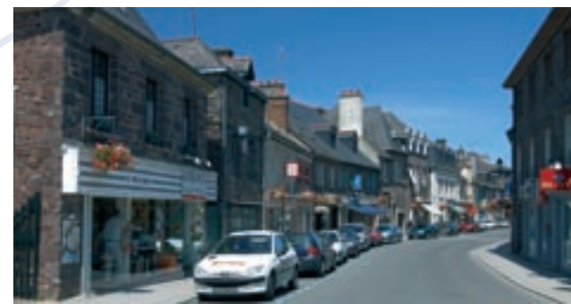
Rue St Nicolas - Montfort sur Meu