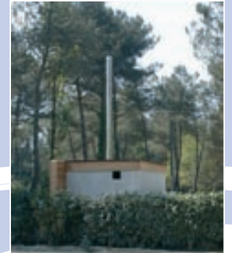
Chaudière à bois - Trémelin